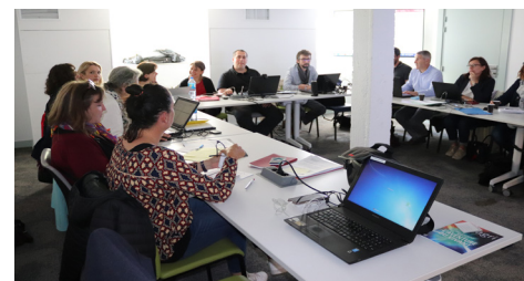
Réunion du collectif ACACED - juin 19

Contact : bertrand.schmieden@educagri.fr