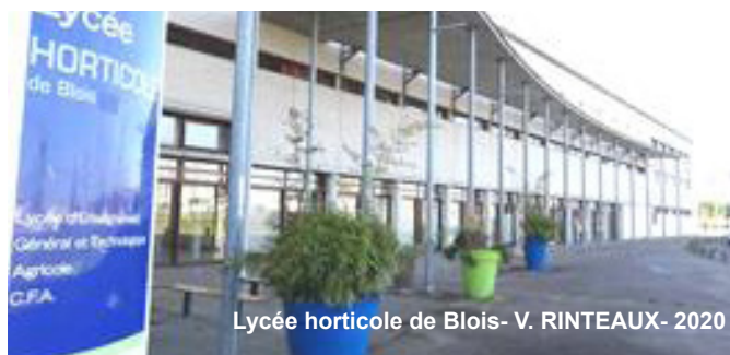
Lycée horticole de Blois- V. RINTEAUX- 2020