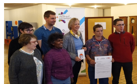
Une Ministre, des travailleurs et des projets...