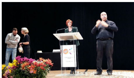
La présidente du réseau lors de la cérémonie à Orléans

755 REMISES D'ATTESTATION POUR LE RÉSEAU